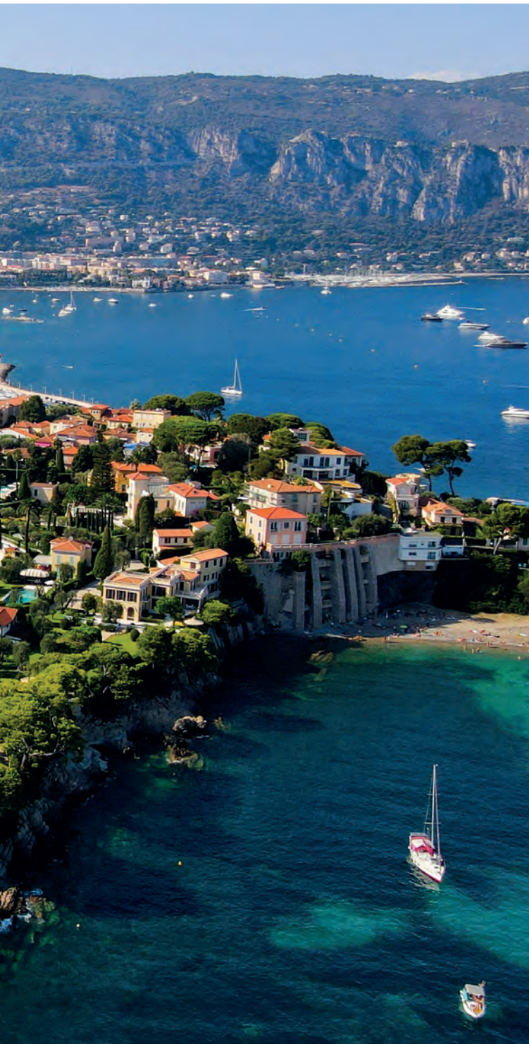
Texts → David Palacios